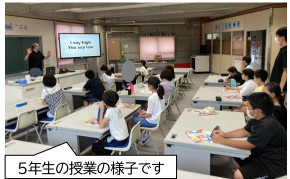
5年生の授業の様子です