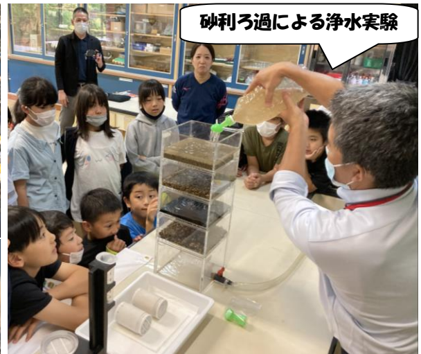
砂ろ過による浄水実験