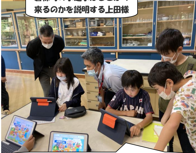
浄水場のしくみを楽しく学べるアプリを使って 学習する子どもたち