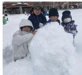
2年生の雪遊び (大雪となった19日)